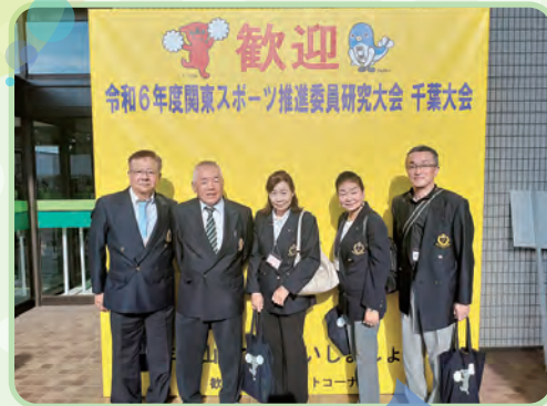
ひたちなか市より 参加しました