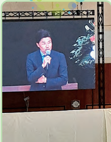
北京オリンピック 陸上競技4×100mリレー銀メダリスト 末續 慎吾氏の講演